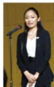
特別ゲスト安藤美姫さん