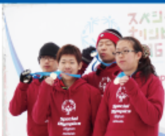
リレーでも金メダル