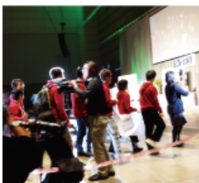
入場行進、北海道は先頭です

新潟大会に出場するにあたり、多くの企業様、ファミリーの皆様にご支援を頂きましたと共に、大会期間中はファミリーの皆様にも多くの声援を頂きまして誠にありがとうございました。おかげ様をもちまして全員が新潟の地で活躍することができました。団長としてアスリートがこれまでの練習