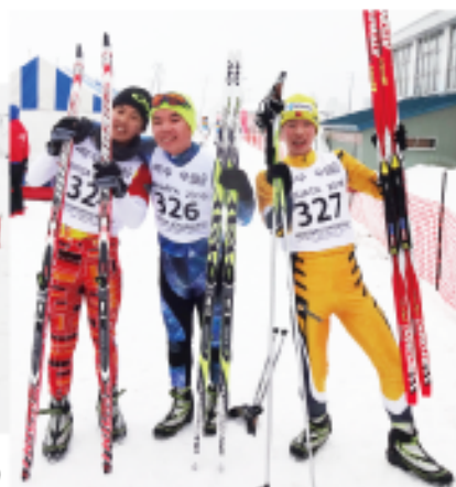
クロカン王国北海道になるか？