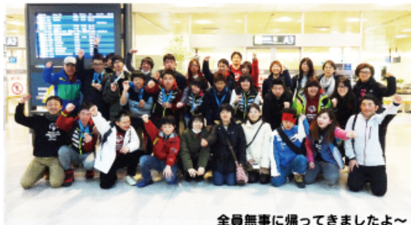
全員無事に帰ってきましたよ～