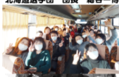
移動中のバスはマスクだらけ

新潟大会に出場するにあたり、多くの企業様、ファミリーの皆様にご支援を頂きましたと共に、大会期間中はファミリーの皆様にも多くの声援を頂きまして誠にありがとうございました。おかげ様をもちまして全員が新潟の地で活躍することができました。団長としてアスリートがこれまでの練習