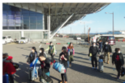
新潟空港着きました

2016年2月12日(金)～14日(日)まで新潟県(新潟市/南魚沼市)で開催されましたSO日本・冬季NG新潟大会に北海道選手団はアスリート17名、コーチ12名で出場しました。