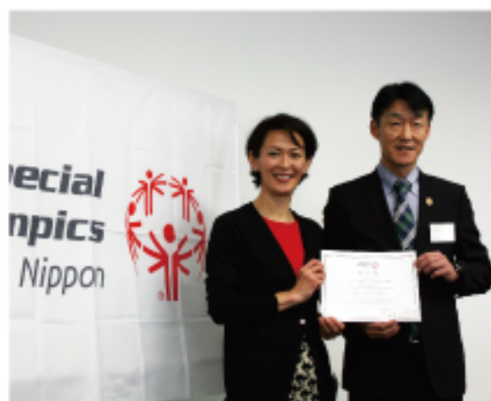
理事長より認定証を授与

会議は有森理事長からの挨拶があり、その中で2018年夏季NG開催地がSON愛知に決定したことの報告がありました。