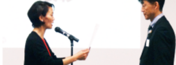
地区組織自己評価表彰「きらり賞」受賞