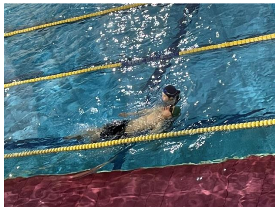
札幌では4月から水泳プログラムがスタート（4月）