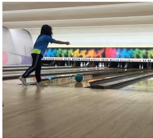
紋別では1月から2グループに分けてボウリングプログラムを行ってきました（4月）