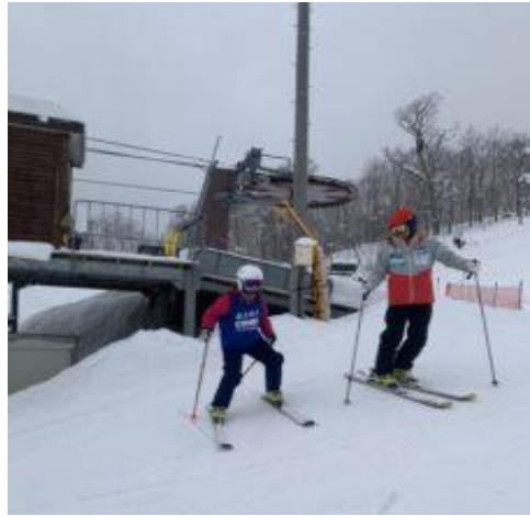
名寄ピアシリスキー場では来年の大会に向けアルペンスキー！頑張りました！（2月）