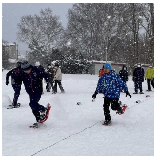
函館でもスノーシューイングのトレーニング（1月）