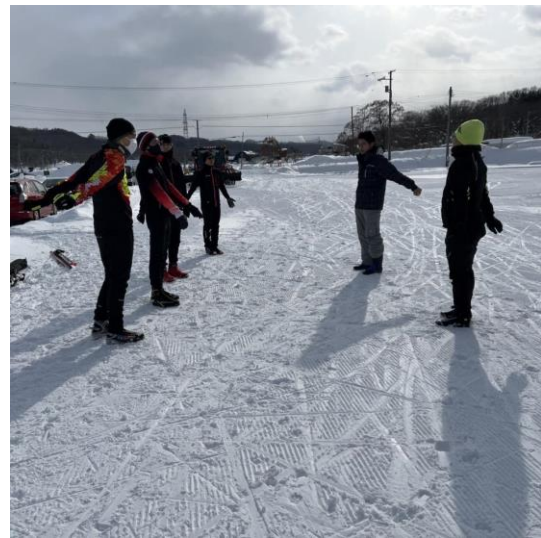
寒い寒い旭川でスノーシューイングとクロスカンリースキーのトレーニング（1月）